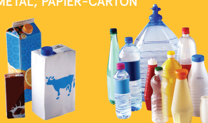
Briques en carton

EMBALLAGES EN PLASTIQUE, MÉTAL, PAPIER-CARTON