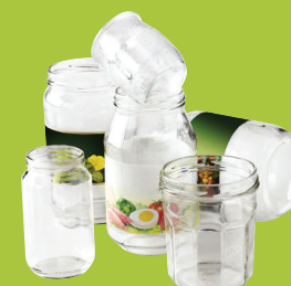
Pots & bocaux en verre